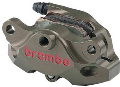
Rear CNC Caliper Kit 2P ハードアナダイズド 120.A441.10

(パッドの確認および交換については、「分解整備」にあたる作業が含まれるため国土交通省の指導により、ユーザー様ご自身ではなく自動車分解整備事業者(認定工場)にて行ってくださいますようお願い申し上げます)