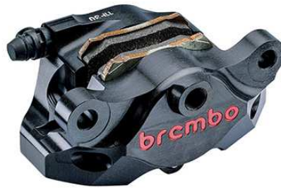
Rear CNC Caliper Kit 2P ブラックアルマイト 120.A441.30