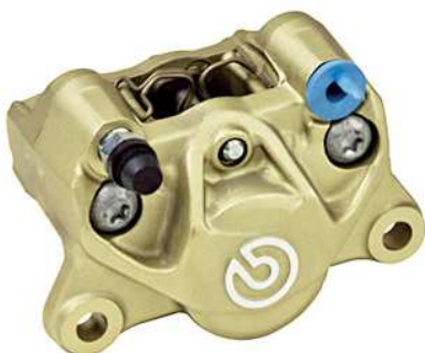
P2 34 Cast Rear Caliper ゴールド (新カニ) 20.B852.10