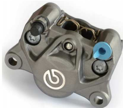
P2 34 Super Sports Cast Rear Caliper チタニウムカラー 20.B852.70