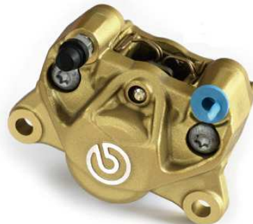
P2 32 Cast Rear Caliper ゴールド (新カニ) 20.B851.11