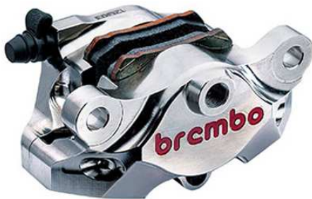
Rear CNC Caliper Kit 2P ニッケルコーティング 120.A441.40