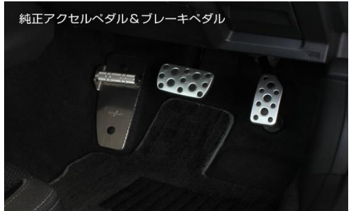
純正アクセルペダル&ブレーキペダル

このモデルの純正アクセルペダルは、アクセルレーターからペダルまで一体式の構造となっているため、今回のアクセルペダルNEOはカバータイプとなりますが、機能的であることはもちろんのこと、脱落することのない確実な固定ができる安全設計としています。