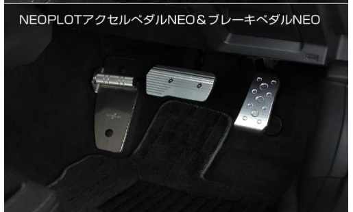
NEO PLOTアクセルペダルNEO&ブレーキペダルNEO