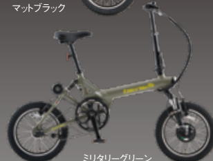
ミタリーグリーン