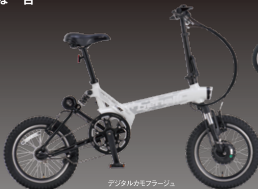
デジタルカモフラージュ