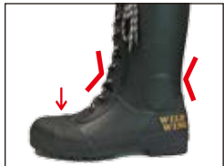
ジャストフィット

スニーカーのようなフィット感。疲れにくく登山の可能な機動力。ぬかるみでもしっかり足をサポートします。サイズ調節用の中敷きも付属しています。