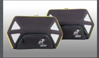
ロイスターイエローzipソフトバッグ左右セット

C-Bowに装着可能なバッグ、セミハードで防水性にも優れて います。容量片側22L。グレーの設定もあります。