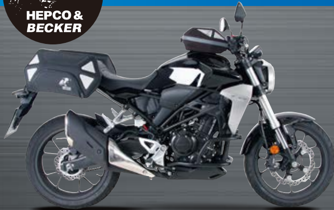
*写真の車両にはタンクバッグ ロイスターDaypackグレーzip ロイスターブラックzipソフトバッグ左右セットが装着されています。