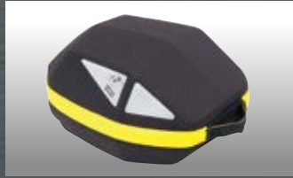
タンクバッグ ロイスターDaypackイエローzip

品番：5069502-0009 価格(税抜)¥6,800 JAN：4549950355779