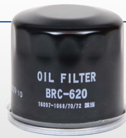
カートリッジタイプ (ガスケット付 BOY-007、BOY-008は除く)