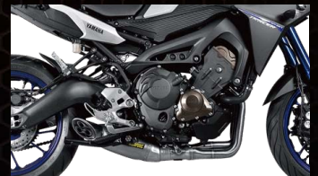
アクラポヴィッチ レーシングライン 専用サイレンサー

適合車種：汎用 カラー：イエロー 品番：640620-0007 価格(税抜)¥29,000