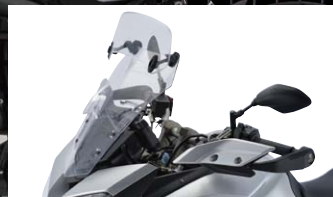
MRA X-CRENSPORTS ユニバーサル

適合車種：MT-09 TRACER カラー：スモーク 品番：MR265S 価格(税抜)¥15,400