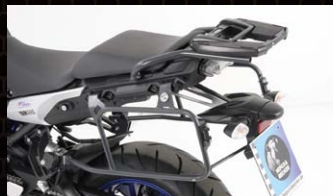
ヘブコ&ベッカー サイドケースホルダー Lock it

適合車種：MT-09 TRACER カラー：アンスラサイト 品番：6504547-0105 価格(税抜)¥24,000