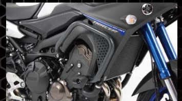
ヘブコ&ベッカー エンジンガード

適合車種：MT-09 TRACER 品番：PHA350D 価格(税抜)¥5,500