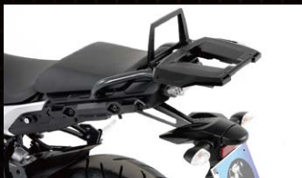
ヘブコ&ベッカー トップケースキャリア

適合車種：MT-09 TRACER カラー：アンスラサイト 品番：5014547-0005 価格(税抜)¥26,600