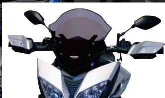
MRA スクリーン レーシング

ラウンドさせた独自のデザインで優れた空力特性を実現。トップスピードにおける空力の優位性はMOTO-GPで実証済み。クリア、ブラック(価格別)の設定もあります。