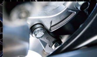
エフェックス ローダウンキット

定つき性と操安性のベストバランス。シート高15mmダウン。車高を下げることで定つき性を向上させます。別売りで起き気味になった車体を適正化するショートサイドスタンド PHS350A 価格(税抜)¥15,000もあります。