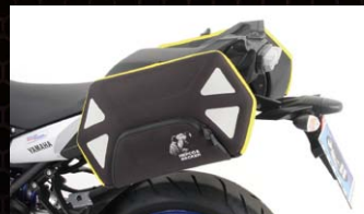
ヘブコ&ベッカー ロイスター

適合車種：MT-09 TRACER カラー：アンスラサイト 品番：6504547-0005 価格(税抜)¥39,200