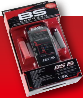
使い勝手のよい収納式マルチフックを装備