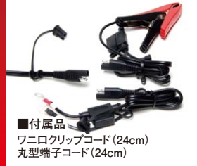
■付属品 ワニ口クリップコード(24cm) 丸型端子コード(24cm)