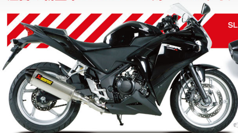
SLIP-ON e1 HEXAGONAL ステンサイレンサー