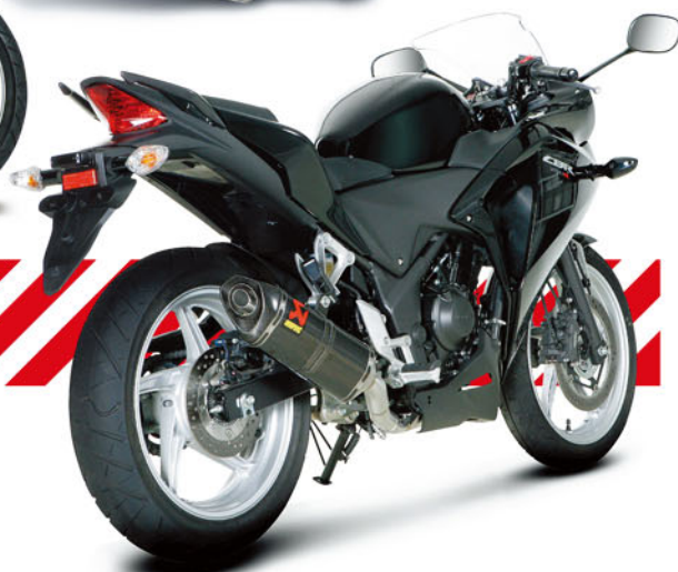
SLIP-ON HEXAGONAL カーボンサイレンサー