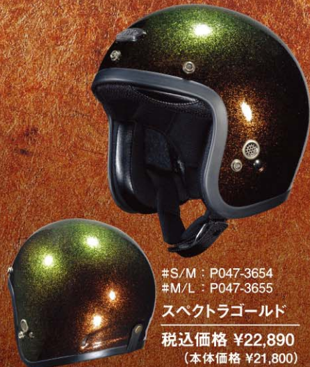
#S/M : P047-3654 #M/L : P047-3655 スペクトラゴールド 税込価格 ¥22,890 (本体価格 ¥21,800)

ヘルメット本来の目的である安全性を開発の原点に置き、ハイクオリティジェットヘルメットを追求する「ZAP」。 SG規格で要求される基準を余裕をもってクリアする「安全性能」のみならず、快適な「機能性」とストリートで注目を集める「デザイン性」を高次元で実現してきました。 新たにラインナップした「J-BEAT」は、まさに革命的とも言える、かつてない独自の新機能（サウンドインテークシステム）を装備しています。 これにより、ヘルメット着用時の閉塞感から解放され、バイクのエキゾーストサウンドがよりナチュラルに聞こえます。 さらに、「J-BEAT」は米国カスタム塗装「ALSA PAINT」を採用し、深みのあるオリジナリティ溢れるカラーリングを実現しました。 ビンテージ感溢れるクールなスタイリングと究極の新世代機能の融合、ジェットヘルメットの最新スタンダードとして、自信をもって提案します。