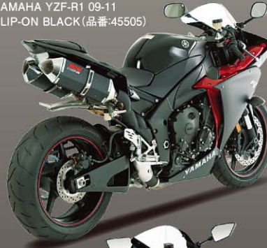
YAMAHA YZF-R1 09-11 SLIP-ON BLACK (品番:45505)