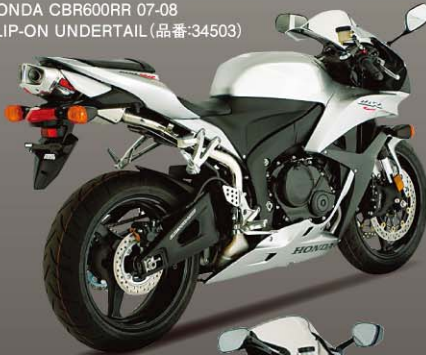
HONDA CBR600RR 07-08 SLIP-ON UNDERTAIL (品番:34503)