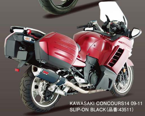
KAWASAKI CONCOURS14 09-11 SLIP-ON BLACK (品番:43511)

掲載車種以外にもラインナップ多数有り!詳しくはプロトカタログ2011-2012 P369~P372をご覧ください。