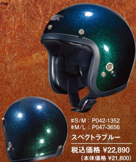
#S/M : P042-1352 #M/L : P047-3656 スペクトラブルー 税込価格 ¥22,890 (本体価格 ¥21,800)