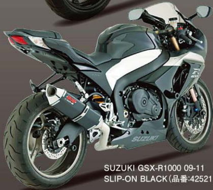
SUZUKI GSX-R1000 09-11 SLIP-ON BLACK (品番:42521)