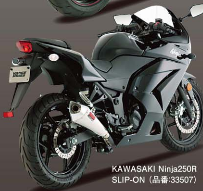
KAWASAKI Ninja250R SLIP-ON (品番:33507)