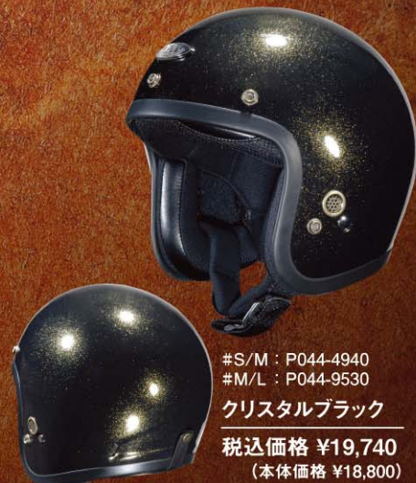
#S/M : P044-4940 #M/L : P044-9530 クリスタルブラック 税込価格 ¥19,740 (本体価格 ¥18,800)