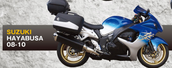
SUZUKI HAYABUSA 08-10