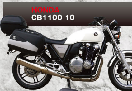
HONDA CB1100 10