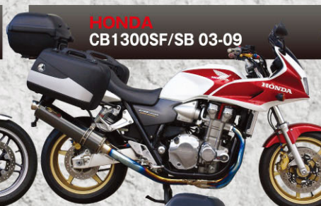
HONDA CB1300SF/SB 03-09