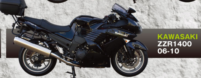
KAWASAKI ZZR1400 06-10