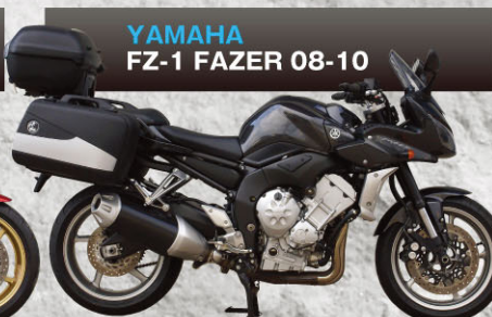
YAMAHA FZ-1 FAZER 08-10