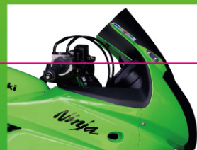
プロト セパレートハンドル スペーサ有り 約50mmダウン