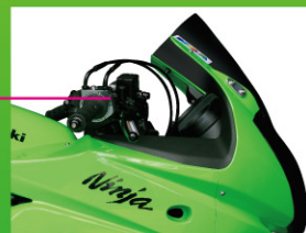
プロト セパレートハンドル スペーサ無 約55mmダウン