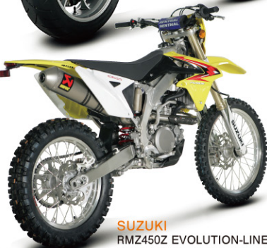
SUZUKI RMX450Z EVOLUTION-LINE