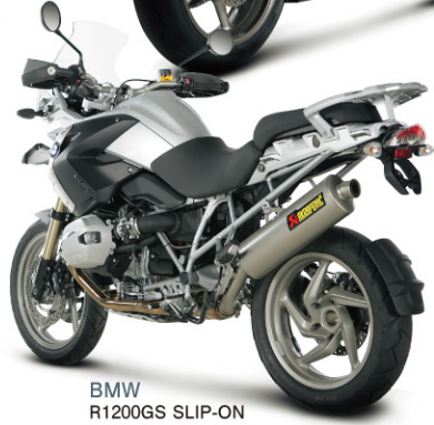
BMW R1200GS SLIP-ON