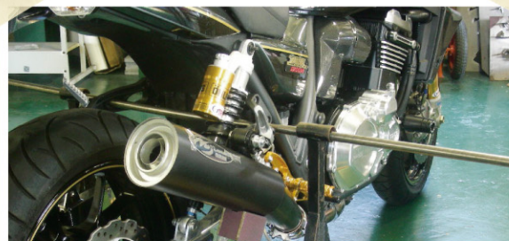
FASARM MEGAPHONE for ZRX1200DAEG 09-10