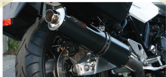
FASARM GT DLC-TITAN for CB1300SF 08-10