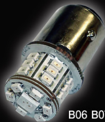
B06 B07 B08 B11