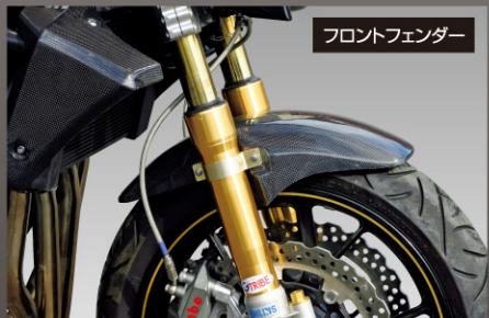
フロントフェンダー