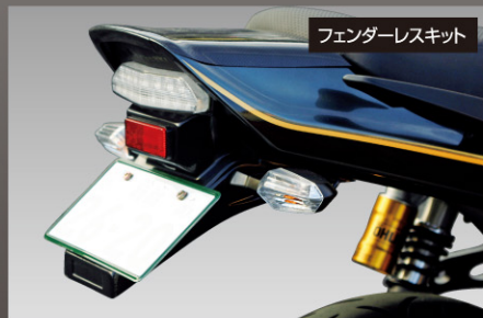
フェンダーレスキット