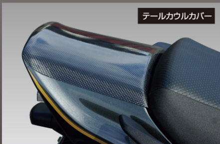
テールカウルカバー