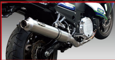
■ USメガホン (メガホンサイレンサーは競技専用につき公道走行不可)