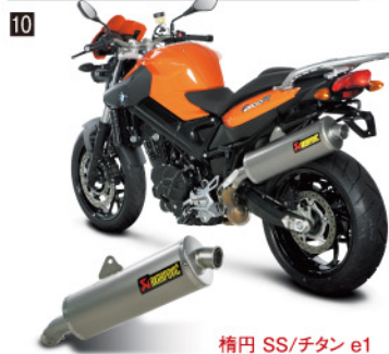
精円 SS/チタン e1