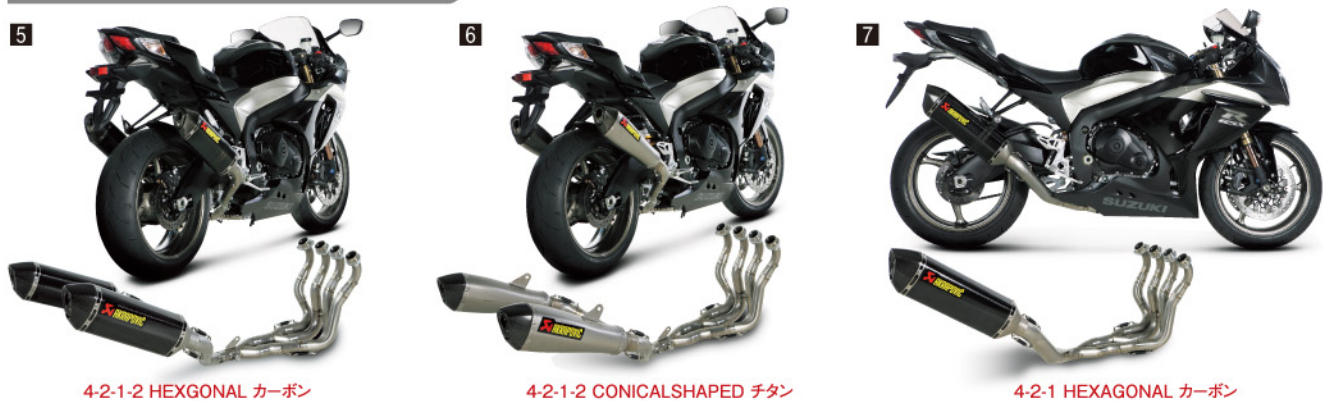
4-2-1-2 HEXAGONAL カーボン