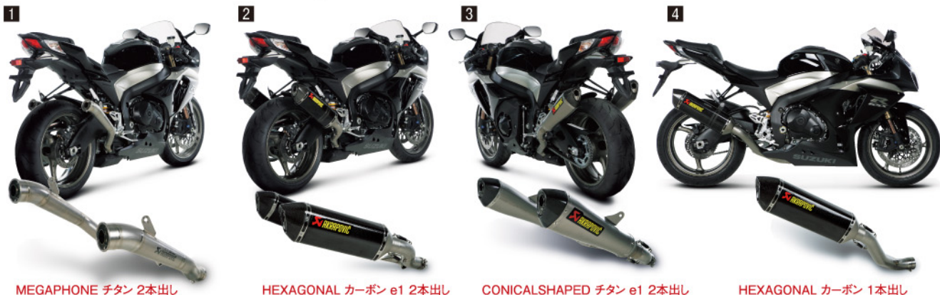
MEGAPHONE チタン 2本出し