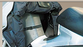
起毛裏地で寒い真冬も足元ボカボカ。