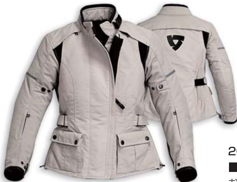
ライトグレー(ホワイト)