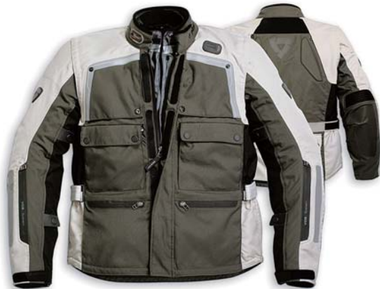
ダークグリーン/グレー