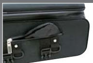
レインカバー内蔵

品番 59011 価格 ¥14,490(税込) ¥13,800(本体) サイズ H470mm W310mm D260mm 容量 約20L