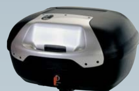
■ Junior Flash サイドケース