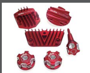
CRF50用エンジンビレットキット