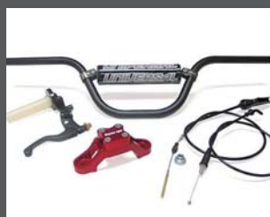
CRF50用MXバー&クランプキット

フレーム、スイングアーム、スキッドプレート等の車体パーツからエンジンカバー、外装キット等のドレスアップパーツまで個性的なラインナップを誇ります!