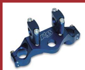
トリプルアッパークランプ