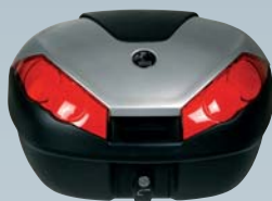
■ Journey トップケース