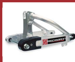
KLX110用ロングスイングアーム