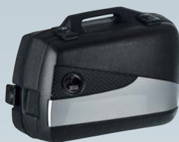
■ Journey サイドケース