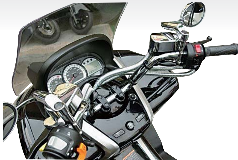
※写真はSMC320のキット内容と装着例

スクーターカスタムブランド「Scuber」より、 新アイテムを追加!! 簡単にマスターシリンダーをメッキにドレスアップ。 取り付けに必要なボルト類も付属し加工なしで 取り付けることができます。