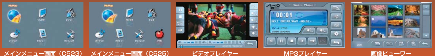
メインメニュー画面 (C523)